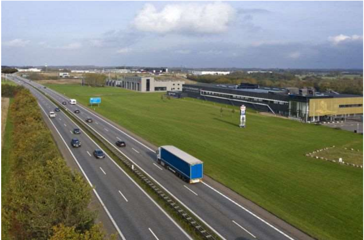
Østjyske Motorvej gennemskærer kommunen på strækningen mellem Vejle og Horsens. Her ses den i nordgående retning lige før afkørslen til Hedensted og Løsning med virksomhederne Østjysk Våbenhandel A/S og Flextek A/S, der som mange andre skilte tydeligt med deres navn.

Stationsbyen Hedensted med næsten 12.000 indbyggere er hovedbyen, men der er en udstrakt grad af decentralisering, således at en del kommunale aktiviteter fortsat hører hjemme i de to tidligere kommunecentre, Juelsminde og Tørring. I havne- og turistbyen Juelsminde bor der ca. 4.000 indbyggere. Herfra var tidligere færgefart, og byen var også stationsby, men nu er det først fremmest turismen, byen lever af. Den tidligere stationsby Tørring dannede sammen med højskolebyen Uldum indtil 2007 fælles kommune. Det er også værd at nævne Hjarnø med færgeforbindelse til Snaptun, udflugtsstederne ved Vejle Fjord samt Vejlefjord Sanatorium, hvor der tidligere blev behandlet tuberkulosepatienter i massevis.