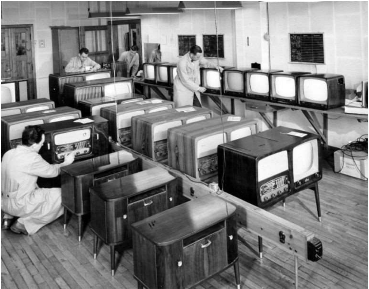
Horsensvirksomheden Arena var i 1960'erne Danmarks største producent af tv-apparater. Den udsprang i 1955 af cykel- og radioproducenten Hede Niensens Fabrikker (senere Hede Nielsen). Få år efter brød tv igennem i den almindelige offentlighed i Danmark, bl.a. med den fjernsynstransmitterede indsamling til Ungarnshjælpen i 1957. Arenas udvikling af især billedkvaliteten på fjernsynsapparaterne gjorde deres apparater meget populære, og allerede i 1950'erne blev de solgt i både ind- og udland. Historien om virksomhedens op- og nedture var inspiration til den fiktive radiofabrik Bella i DRserien Krøniken. Da fabrikken brændte i 1970, blev den genopbygget i samarbejde med den engelske Rank-koncern, og fjernsynsapparaterne blev herefter solgt under navnet Rank Arena. Fabrikken gik konkurs i 1979. Foto: Danmarks Industrimuseum, Horsens Foto fra 1958.

Byen Odder havde præg af at være købstad allerede i midten af 1800-årene, men den egentlige købstadsstatus opnåede byen aldrig. Byen er fortsat stationsby – nu for letbanen fra Aarhus, og der er en mængde små virksomheder i kommunens hovedby med godt 12.000 indbyggere, hvoraf mange pendler til især Aarhus. I kommunen bor der i alt 22. 675 indbyggere.