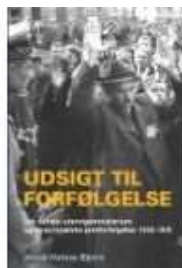
UDSIGT TIL FORFØLGELSE

( http://www.historie-online.dk/boger/anmeldelser-5-5/besaettelsen/elefanten )