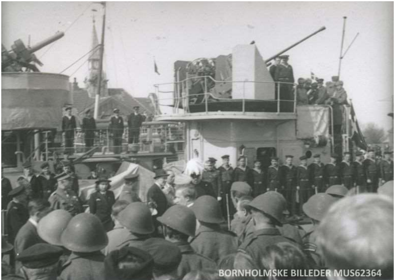
Danskerne siger pænt farvel til russerne ombord på ministrygeren Vladimir Polukhin.