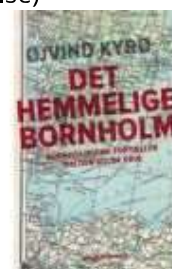
DET HEMMELIGE BORNHOLM

( http://www.historie-online.dk/boger/anmeldelser-5-5/besaettelsen/udsigt-til-forfoelgelse )