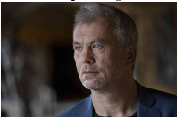
Jesper Stein.