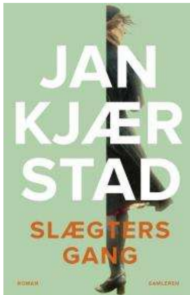
(/boeger/slaegters-gang) SLÆGTERS GANG (/BOEGER/SLAEGTERS-GANG) Af Jan Kjærstad