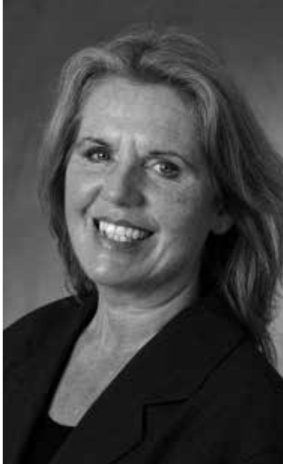
AF LONE SKOV AL AWSSI Debattør og katolik

“Der er ikke fælles fodslag, når det gælder årsagen til at ønske den afskaffet.”