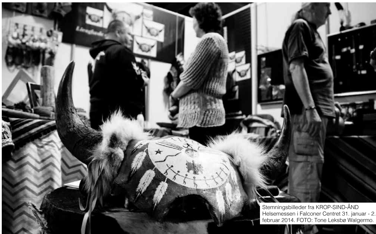
Stemmingsbilleder fra KROP-SIND-ÅND Helsemessen i Falconer Centret 31. januar - 2. februar 2014.

Det skyldes, at folk er dovne, usikre og ikke interesserede i dialog. Kommunikation er det vigtigste, ikke kun at lytte og tage imod. Et fællesskab er sundt, når man kan udveksle meninger uden at blive udelukket. Og når jeg accepteres som det menneske, jeg er. Jeg er altid på vagt over for dem, der har sandheden. Et fællesskab er sundt, når det ikke lukker om sig selv, og hvor man ikke er frelste.”