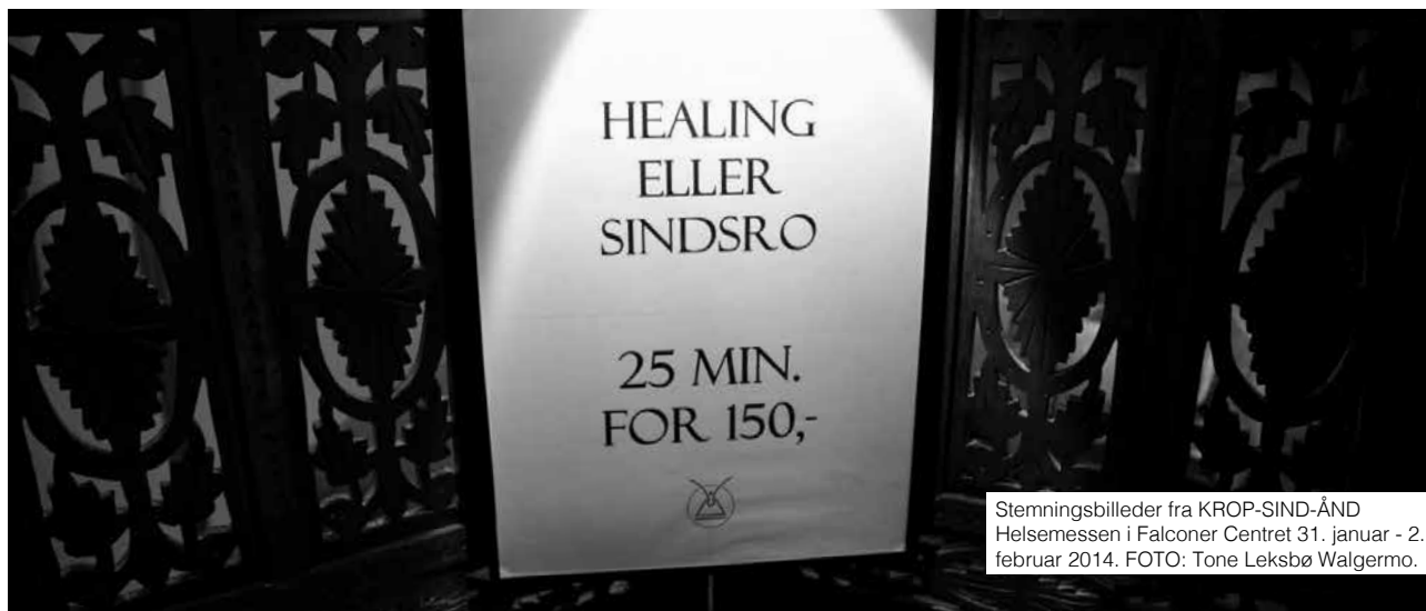
Stemmingsbilleder fra KROP-SIND-ÅND Helsemessen i Falconer Centret 31. januar - 2. februar 2014.

else, og den enkelte kan få lov at give. Det er i orden at være uenige, men der må være en respektfuldhed og dialog. Man skal kunne argumentere uden at blive mast. Der må være en etisk overensstemmelse. Forskellen på sundt og usundt er hjertebaseret. Et fællesskab er usundt, hvis man ikke kan være sig selv uden at blive mobbet. Når nogen suger energi, og hvis man tillader at lade andre suge energien ud af en. Jeg oplever, at der også inden for det nyspirituelle miljø findes pseudofællesskaber, uden respekt. Du er din egen satellit, hvis din spiritualitet og udvikling kun handler om dig selv. Der kan være fællesskab på overfladen, men samtidig en manglende respekt og accept af hinandens ståsted og måde at være på. Hvis for eksempel det, du siger, er vigtigere end din handling, og hvis man ikke interesserer sig for hinanden som mennesker.”