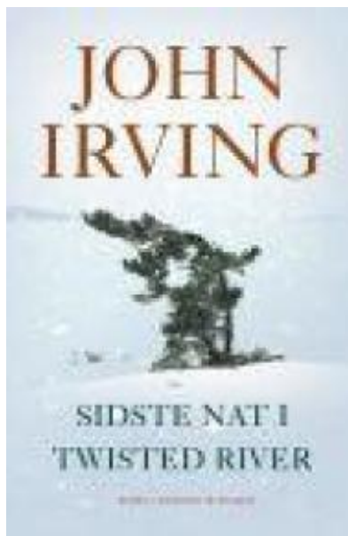
(/boeger/sidste-nat-i-twisted-river) SIDSTE NAT I TWISTED RIVER (/BOEGER/SIDSTE-NAT-I-TWISTED-RIVER) Af John Irving