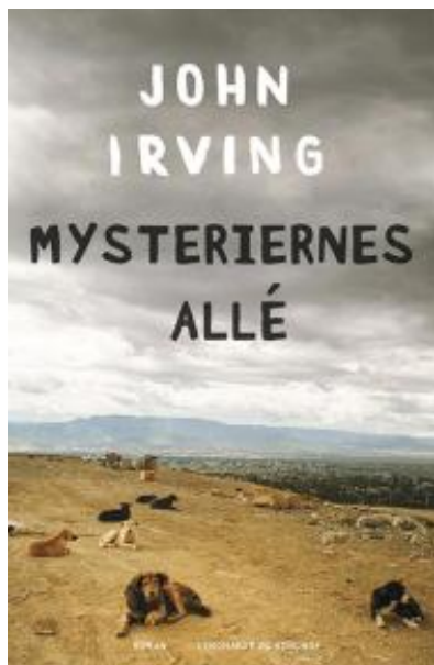
(/boeger/mysteriernes-alle) MYSTERIERNES ALLÉ (/BOEGER/MYSTERIERNES-ALLE) Af John Irving