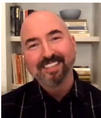
FORFATTEREN TIL “SHUGGIE BAIN”, DOUGLAS STUART.

Dens vej til toppen betegnes som “et litterært eventyr”, fordi det er sjældent, at en forfatterdebutant scorer verdens næststørste litterære pris. Bogen er baseret på 10 års arbejde, der egentlig var tænkt som terapeutisk bearbejdning af egne barndomstraumer. Som hovedpersonen i romanen har forfatterens egen opvækst langt fra været “en dans på roser”.