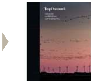
TRAP DANMARK 17 TØNDER, AABENRAA, SØNDERBORG

( http://www.historie-online.dk/boger/trap-danmark-17-toender-aabenraa-soenderborg )