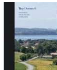
TRAP DANMARK BIND 9

( http://www.historie-online.dk/boger/anmeldelser-5-5/historie-og-topografi-11-11-11/trap-danmark-bind-30 )