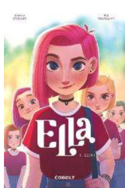
(/boeger/den-nye) DE(N) NYE (/BOEGER/DEN-NYE) Af Kid Toussaint