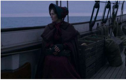
Kate Winslet som paleontolog i 1840'erne i filmen Ammonite .