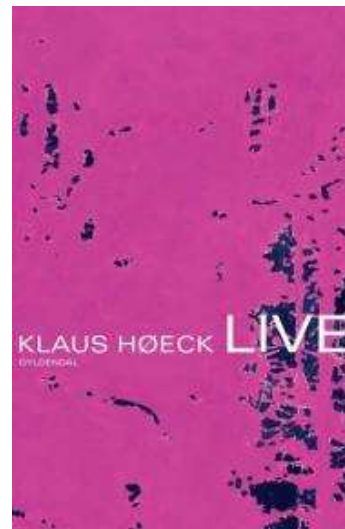
(/boeger/live) LIVE (/BOEGER/LIVE) Af Klaus Høeck