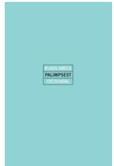
(/boeger/palimpsest-over-et-arhundrede) PALIMPSEST OVER ET ÅRHUNDREDE (/BOEGER/PALIMPSEST- OVER-ET-ARHUNDREDE) Af Klaus Høeck