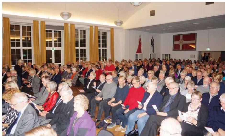
Historisk Samfunds og Sprogforeningens store arrangement på Folkehjem den 17. november 2018 blev noget af et tilløbsstykke. På billedet ses et udsnit af de 395 deltagere.