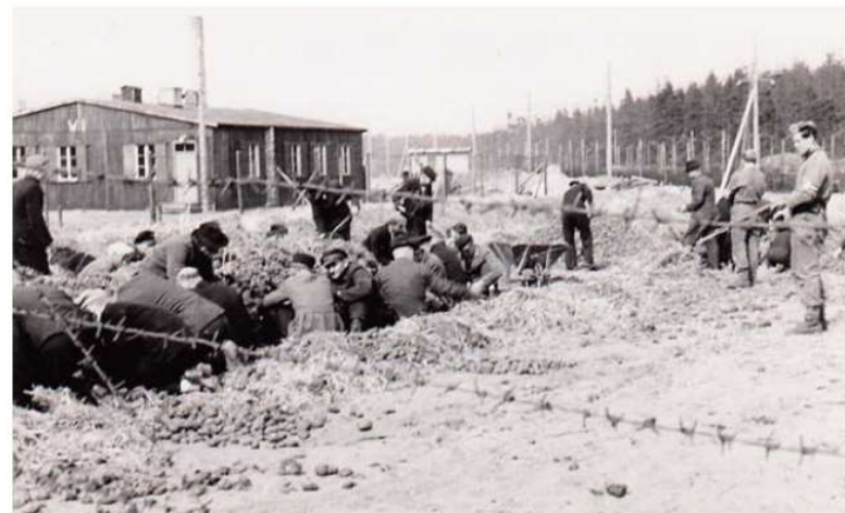
Internerede i Fårhuslejren graver i lejrens kartoffelkule. De interneredes arbejde bestod primært i at opretholde lejrens drift, ligesom det havde været tilfældet med Frøslevlejren.

Museet har ved flere lejligheder i 2018 betjent både de skrevne og de elektroniske medier i forbindelse med formidlingen af Anden Verdenskrig