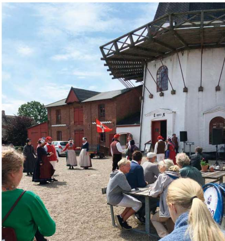
Højer Mølle ser en ny, lovende fremtid i møde med nye udstillinger om Tøndermarskens særlige kulturlandskab samt en ny café, der skaber langt bedre forhold for publikum.

Højer Mølle lukkede for publikum medio 2018, da omdannelsen til den kulturhistoriske port til Vadehavet blev påbegyndt. Projektet er en del af Tøndermarsk-initiativet, der støttes af en række store fonde som Realdania, A.P. Møller-fonden og Nordea-Fonden. Gennem 2018 og frem til efteråret 2019 gennemgår Højer Møllens to magasinbygninger, Store Spiker og Lille Spiker, en gennemgribende restaurering og indrettes med nye, indbydende og engagerende udstillinger, der fokuserer på det særlige kulturlandskab, som marsken og dens byer er udtryk for. I sammenhæng med dette projekt gennemfører Museum Sønderjylland en omfattende ombygning og om-