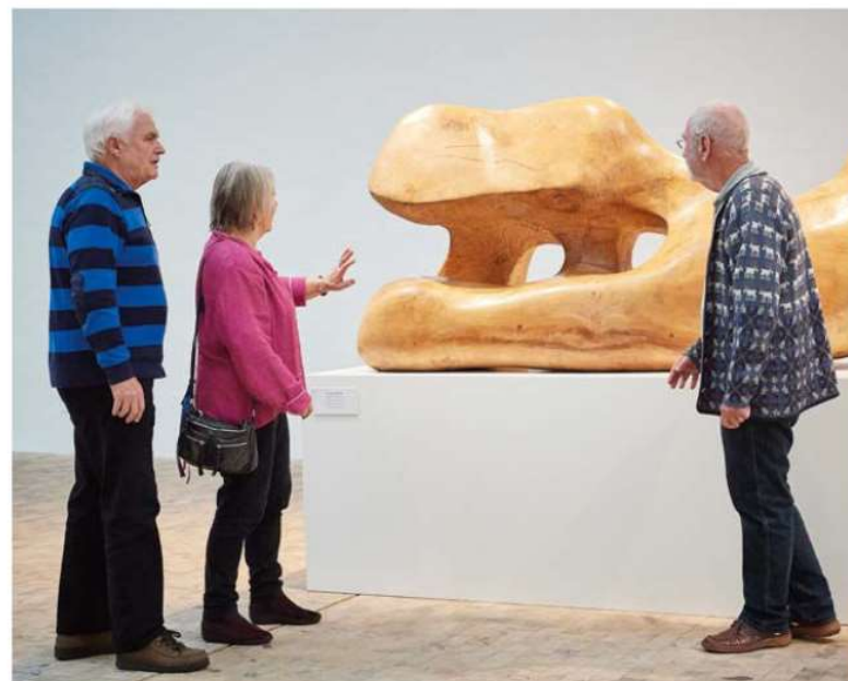
Museerne i Tønder består af kunstmuseet og det kulturhistoriske museum, der begge har hjemme i et museumskompleks, som kan måle sig med de bedste i landet og i sig selv er et besøg værd. Henry Moore-udstillingen viste, at større og ambitiøse særudstillinger kan påvirke besøgstallet positivt.

Museets to fyrtårne, Sønderborg Slot og Museerne i Tønder, udviste trods den varmeste sommer til dato målt i Danmark udmærkede besøgstal omkring det normale niveau. I 2018 var der ikke som i 2017 en landsdækkende spejderlejr med flere tusinde gæster, hvorfor et besøgstal på 53.148 mod 56.322 er ganske udmærket, ikke mindst sommeren taget i betragtning; det vil sige et fald på 6 %, hvilket må betragtes som normaludsving.