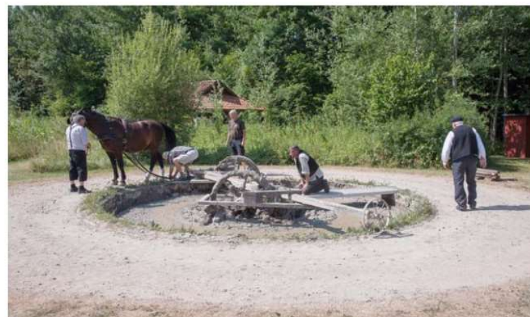
Cathrinesmindes enestående velbevarede kulturmiljø danner rammen om styrkede formidlingsaktiviteter hen over sommeren med både levendegørelse af arbejdet og livet knyttet til teglværket og med den fire dage lange festival Levende Teglværk, hvor hele teglværket er bemanded og summer af liv.

Endelig har afdelingen arbejdet med modeller for projektstyring og budgetlægning, som skal implementeres på tværs af museet ved udstillinger og større aktiviteter. Årsplanlægningen søges i 2019 rykket frem, således at der tidligere på året foreligger en plan for udstillinger og aktiviteter i det følgende år.