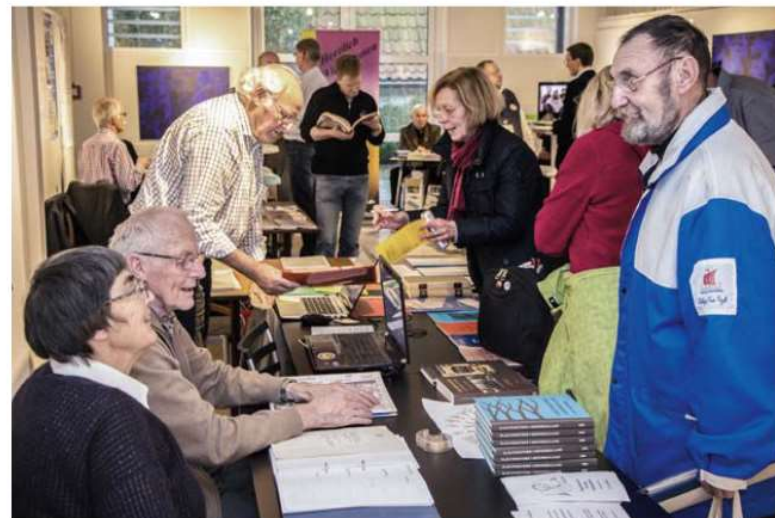
Fra Historiske Dage 2019.

Vanen tro deltog FA og DSS på en fælles sønderjysk stand ved de Historiske Dage i København i marts måned 2019. I årets udgave af Historiske Dage havde vi valgt at fokusere på "æ sproch" og vise grænselandets sproglige særpræg på sønderjysk, frisisk og plattysk. På vores stand var der rig lejlighed til at deltage i konkurrencer, få smagsprøver, se filmklip og andet godt, som illustrerede de forskellige sprog og dialekter. Derudover var der gode tilbud på bøger om sønderjysk og slesvigsk historie samt mu-