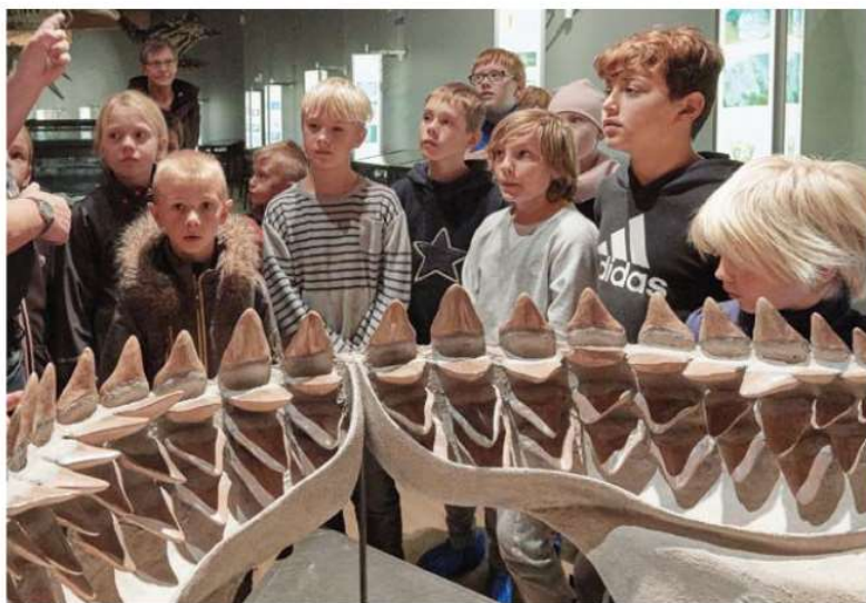
Gram Lergrav, hvor der fortsat gøres vigtige fund med bistand fra publikum, rummer med kombinationen af museum og aktiviteter i lergraven et stort potentiale for formidling af naturhistorie til børn og unge.

som tilsyneladende har været nedgravet i et stort vikingehus. Det tyder på, at skatten har tilhørt en stormand, som har gemt sin opsparring af vejen. Mønterne er præget så langt væk som i Mellemøsten og Frankeriget, der dækkede det nuværende Italien, Frankrig og Tyskland.