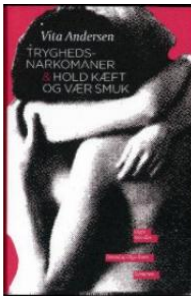
(/boeger/tryghedsnarkomaner-hold-kaeft-og-vaer-smuk) TRYGHEDSNARKOMANER & HOLD KÆFT OG VÆR SMUK (/BOEGER/TRYGHEDSNARKOMANER-HOLD-KAÆFT-OG-VAER-SMUK) Af Vita Andersen