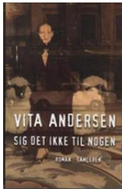
(/boeger/sig-det-ikke-til-nogen-1) SIG DET IKKE TIL NOGEN (/BOEGER/SIG-DET-IKKE-TIL-NOGEN-1) Af Vita Andersen