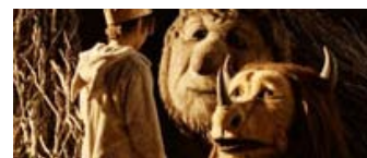
Fig. 4, fig. 5, fig. 6: KW personificerer både søsteren, der søger væk fra flokken, men også moderen, der beskytter Max, da det bliver nødvendigt. Alexander personificerer Max' usikkerhed og Judith hans ondskabsfuldhed.

Where The Wild Things Are er en sjælden ren hyldest til barndommen på godt og ondt og en poetisk beskrivelse af barnets umiddelbarhed, fantasifuldhed og skrøbelighed. Filmens største svaghed er, at den placerer sig mellem to stole, hvor den på nogle punkter er for kompleks til at være en børnefilm, men samtidig heller ikke er helt substantiel nok til at være en decideret voksenfilm. Men det er en lille