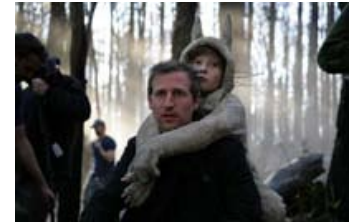
Fig. 1: Spike Jonze startede sin instruktørkarriere som musikvideoinstruktør for bl.a. Fatboy Slim, Beastie Boys og Bjørk. Ved siden af sin filmkarriere har han instrueret et hav af reklamefilm og er desuden fungerende kreativ chef for den MTV-finansierede online-kanal VBS.tv.

Kostumerne til de store dyr er blevet skabt hos Jim Henson Creative Shop ud fra Maurice Sendaks grafiske forlæg, og det giver filmen en dragende realisme, at dyrene faktisk er til stede i den virkelige skov sammen med Max. Brugen af følt håndholdt kamera medvirker ligeledes til en stærk indlevelse, og når Max tumler rundt med de store dyr, bobler den barnlige iver, og man har bare lyst til at kaste sig ind i bunken og lege med. Bortset fra dyrenes elegant eksekverede computeranimerede ansigter er filmen helt tom for 3D effekter og CGI, og det er her Jonzes visuelle sensibilitet triumferer i en eventyrgenre, der med tiden synes fuldstændig druknet i hæsblæsende effektjageri. Det er en befrielse at nyde en ren og næsten analog eventyrfilm, hvor