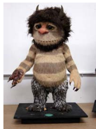
Fig. 8: En tidlig model af Carol, skabt hos Jim Henson Creative Shop.