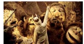
Fig. 3: Max er iført ulvekostume under hele sit ophold på øen og bliver dermed en naturlig del af det dyriske univers. Samtidig bliver kostumet en metafilmisk kommentar til de øvrige dyr, der i virkeligheden også blot er store børn i dyrekostumer.