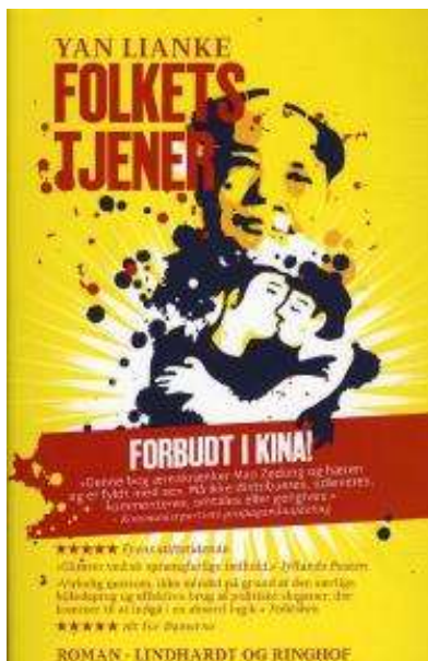
(/boeger/folkets-tjener) FOLKETS TJENER (/BOEGER/FOLKETS-TJENER) Af Yan Lianke