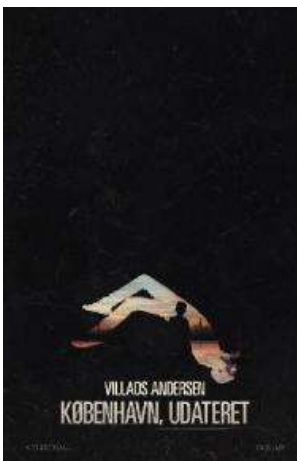
(/boeger/koebenhavn-udateret) KØBENHAVN, UDATERET (/BOEGER/KOEBENHAVN-UDATERET) Af Villads Andersen (f. 1988)