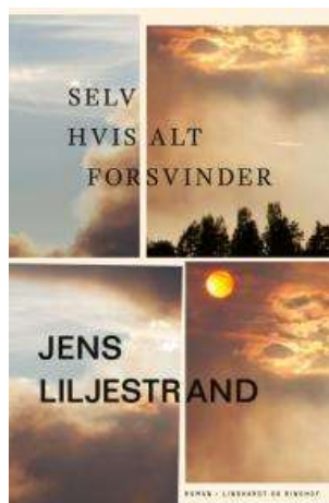
(/boeger/selv-hvis-alt-forsvinder) SELV HVIS ALT FORSVINDER (/BOEGER/SELV-HVIS-ALT-FORSVINDER) Af Jens Liljestrand