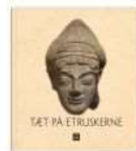
TÆT PÅ ETRUSKERNE

( http://www.historie-online.dk/boger/sparta )