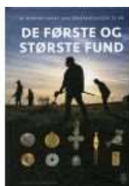
DE FØRSTE OG DE STØRSTE FUND

( http://www.historie-online.dk/boger/de-foerwste-og-de-stoerste-fund )