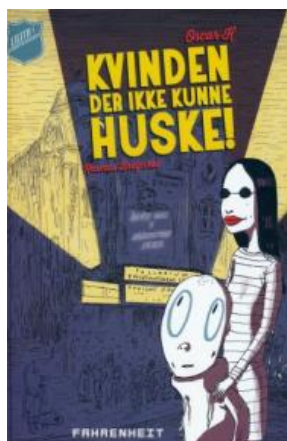
(/boeger/kvinden-der-ikke-kunne-huske) KVINDEN DER IKKE KUNNE HUSKE! (/BOEGER/KVINDEN-DER-IKKE-KUNNE-HUSKE) Af Oscar K.