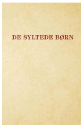
(/boeger/de-syltede-born) DE SYLTEDE BØRN (/BOEGER/DE-SYLTEDE-BØRN) Af Oscar K.