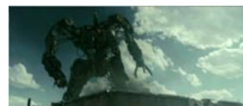
Fig. 8. En 'harvester'.