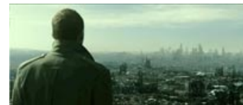
Fig. 1. Marcus (Sam Worthington) vækkes til 'live' og ser for første gang det post-apokalyptiske landskab.

Hver Terminatorfilm har fokuseret på forskellige konstellationer. I The Terminator (1984) kommer parret i fokus - Sarah Connor (Linda Hamilton) og Kyle Reese (Mikael Biehn). I Terminator 2 – Judgment Day (1991) er det familien med Sarah Connor (Hamilton igen), sønnen John (Edward Furlong) og The Terminator (Arnold Schwarzenegger) som surrogatfaderen, der kæmper en brav kamp mod den nyeste T-1000 model (Robert Patrick). I Terminator 3: Rise of the Machines assisterer The Terminator (Schwarzenegger) det unge par John Connor (Nick Stahl) og Kate Brewster (Claire Danes), mens ærkefjenden er den forførende Terminatrix - eller T-X – spillet af Kristanna Loken.