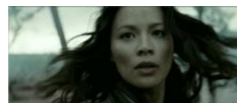
Fig. 10. Williams' etnicitet afsløres ikke i filmen, men fremgår af hendes udseende.