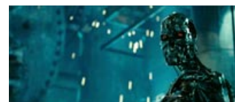
Fig. 2. I Terminator Salvation er der ikke én markant Terminator-antagonist, men bl. a. en hær af disse piratlignende dødningshoveder med onde røde øjne.