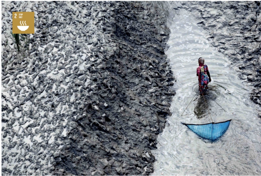
EN KVINDE FISKER MED NET I DELTAET SYD FOR PADMAPUKUR, KHULNA-DISTRIKTET, BANGLADESH (22° 15' 58.86" N – 89° 11' 42.63" E)

I modsætning til 2015-målene, som primært fokuserede på udviklingslandene, bliver alle FN-nationer denne gang målt på, hvor godt de opfylder målene.