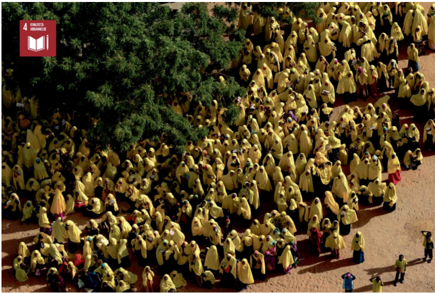
SKOLE I HAGADERA-LEJREN, DAADAB, GARISSA REGIONEN, KENYA (0° 0' 0.39" S – 40° 21' 52.99" E)

I bogen kan man også læse, at ni ud af 10 af verdens børn kommer i skole. Nu er målet så at få kvalitet i uddannelsen: Bedre uddannelse af lærere, færre børn i klasseværelserne, bedre undervisningsmidler, afskaffelse af børneægteskaber.