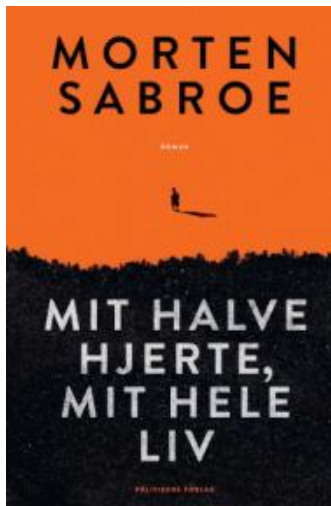
(/boeger/mit-halve-hjerte-mit-hele-liv) MIT HALVE HJERTE, MIT HELE LIV (/BOEGER/MIT-HALVE-HJERTE-MIT-HELE-LIV) Af Morten Sabroe