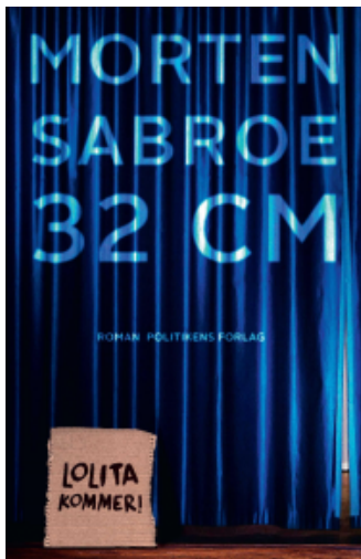
(/boeger/32-centimeter) 32 CENTIMETER (/BOEGER/32-CENTIMETER) Af Morten Sabroe