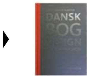
DANSK BOGDESIGN I DET 20. ÅRHUNDREDE

( https://www.historie-online.dk/boger/anmeldelser-5-5/kunst-arkitektur-haver-design-mode/dansk-bogdesign-i-det-20-aarhundrede )