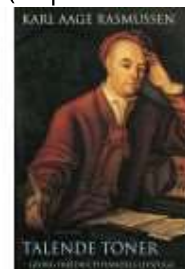
▶ TALENDE TONER - HÄNDEL

( http://www.historie-online.dk/boger/anmeldelser-5-5/musik-teater/bob-dylan-i-amerika )