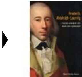
▶ FREDERIK AHLEFELDT-LAURVIG

( http://www.historie-online.dk/boger/anmeldelser-5-5/musik-teater/frederik-ahlefeldt-laurvig )