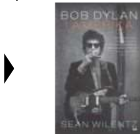
▶ BOB DYLAN I AMERIKA