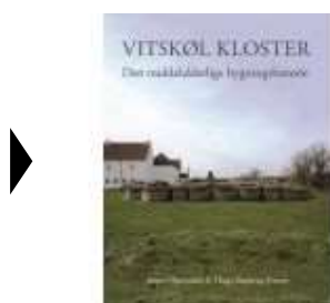
VITSKØL KLOSTER. DEN MIDDELALDERLIGE BYGNINGSHISTORIE.

( http://www.historie-online.dk/boger/anmeldelser-5-5/kirke-og-religion/vitskoel-kloster-den-middelalderlige-bygningshistorie )