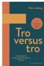
TRO VERSUS TRO

( http://www.historie-online.dk/boger/anmeldelser-5-5/kirke-og-religion/vitskoel-kloster-den-middelalderlige-bygningshistorie )