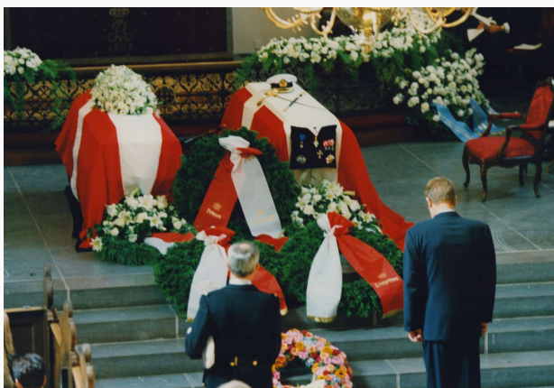
Statsminister Poul Nyrup Rasmussen ved bisættelsen i Holmens Kirke, 12. aug 1996.

Der skulle forberedes hjemtransport af de omkomnes lig, bisættelse af forsvarschefparret ved en statsbegravelse i Holmens Kirke med over 1000 indbudte.