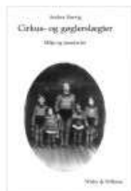
CIRKUS- OG GØGLERSLÆGTER