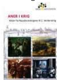
ANER I KRIG