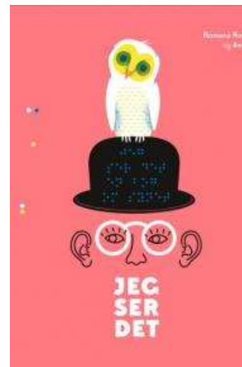
(/boeger/jeg-ser-det) JEG SER DET (/BOEGER/JEG-SER-DET) Af Romana Romanishin og Andrej Lesiv