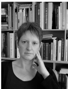
Solvej Balle, fotograferet i 2008.

Solvej Balle er uddannet på forfatterskolen og markerede sig i halvfemserne med den minimalistiske og eksperimenterende stil, som mange forbinder med den tid. Nogle mestrede den og gjorde den til deres egen – forfattere som for eksempel Helle Helle, Christina Hesselholdt, Naja Marie Aidt og altså Solvej Balle – andre mestrede den mindre godt. Balle har udgivet en række anmelderroste bøger, senest kortprosatteksterne Hvis og Så , der begge udkom i 2013.