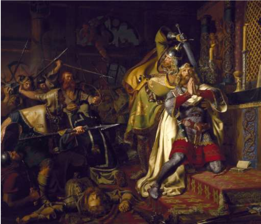
Mordet på Knud den Hellige i Sct. Albani kirke i Odense malet af Christian Albrecht von Benzon (1816 – 1849) i Tyskland i 1843. Billede fra bogen, der ikke har kildeangivelse!

imidlertid, at det ofte resulterer i fejlagtige konklusioner om mordernes identitet. For i realiteten ved vi en hel masse uden i realiteten at vide noget. Med sikkerhed. Og dog: Ét ved vi: "I denne periode havde Danmark en lidt pinlig "tradition". Her var det nemlig kutyme, at konger blev myrdet. Således blev Harald Blåtand dræbt i 985 eller 986, Knud den Hellige i 1086 i Odense og kong Niels i 1134 i Slesvig. I alle disse tilfælde var drabsmændene oprørere. Erik Emune blev myrdet på et ting i Ribe i 1137, Knud Magnussen blev dræbt ved blodgildet i Roskilde i 1156, og senere samme år dræbte bønder Knuds banemand, Svend Grathe... Erik Plovpenning blev myrdet i 1250, Abel blev dræbt af friserne i 1252, og Christoffer 1. blev i 1259 angiveligt forgiftet af abbed Arnfast. Og nu fulgte altså Erik 5. Klipping i 1286. En voldsom omgang kongespil." (s.57).