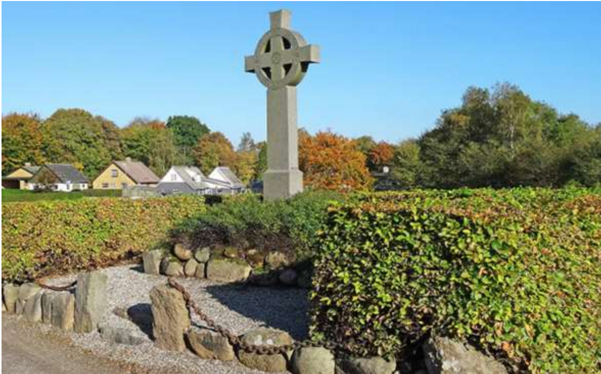
I dag markeres drabsstedet med dette kors

Det, at han ikke fik beskyttelse, tages til indtægt for, at det nok var ham, der med egen hånd dræbte Erik Klipping. Det tilgængelige kildemateriale peger på, at man i samtiden ikke var i tvivl om, hvem der var den egentlige drabsmand. Vel også enighed om, hvem de andre kunne være. Motivet? Forfatteren mener, det er et politisk mord. Kongen blev offer for en politisk sammensværgelse.