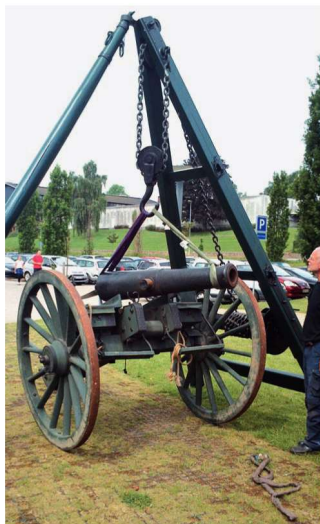
Slesvigske Vognsamlingens værksted har til Historiecenter Dybbøl Banke efter originale tegninger og i original størrelse udført en rekonstruktion af en stor løftekran, der skal anvendes til at løfte de tunge kanoner fra lavetterne.

ster Kirkemusikskole) et feltforskningsprojekt vedr. »Pietismens arvtagere i Vestslægt«, udført af teologistuderende ved Århus Universitet.