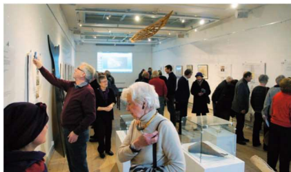
Billede fra åbningen af særudstillingen Røms historie, søfart og livsfangst den 12. januar 2013 på Kulturhistorie Aabenraa.

Møller-fonden betyder, at vi i 2013 kunne publicere en lang række historiske billeder på databasen »Cumulus« fra Sønderjyllands nationale historie.