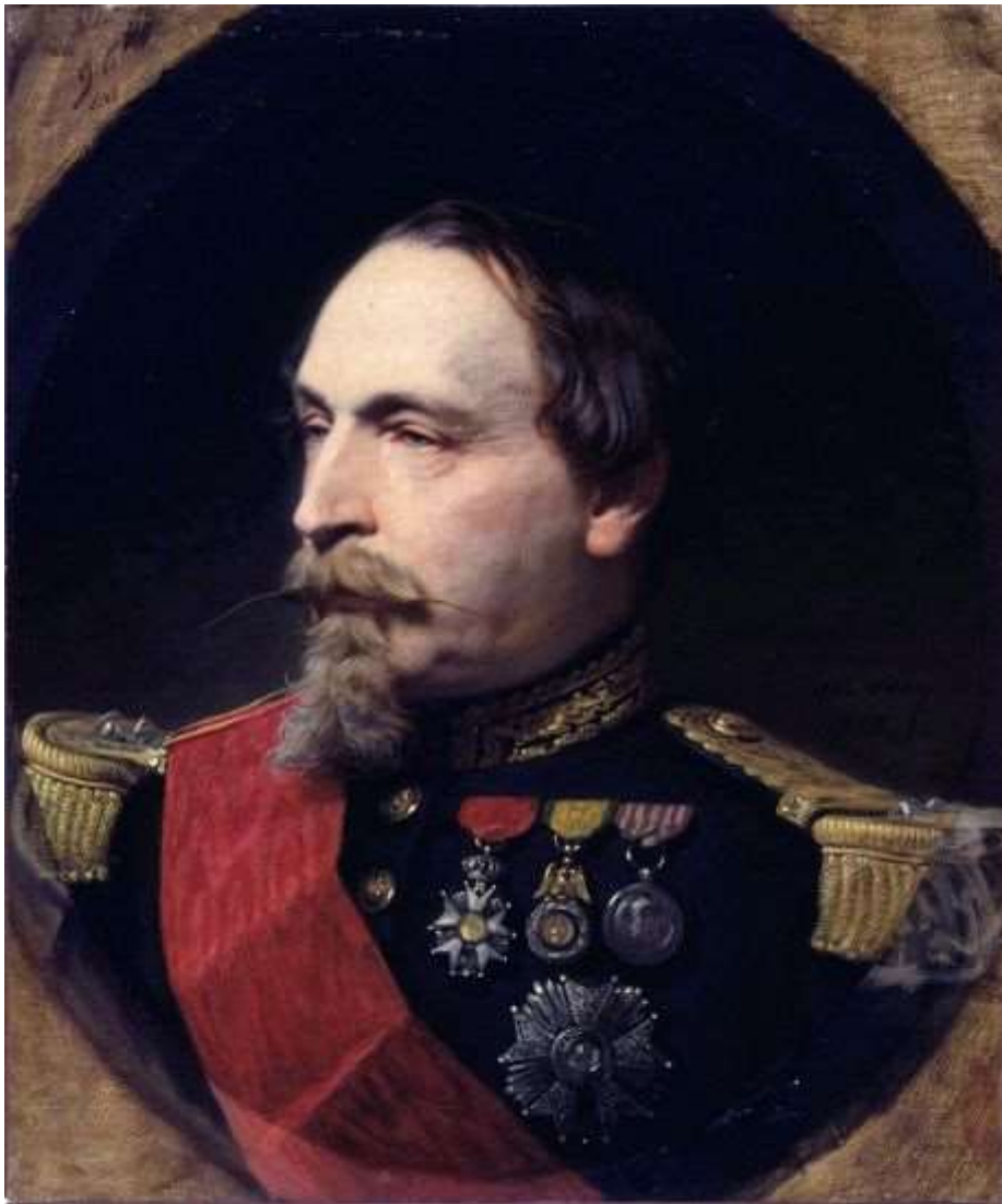
Napoleon III som magtfuld person. Ikke just det, der svarede til hans ageren i 1870

Da England i 1939 erklærede krig mod Tyskland, gik der mange måneder, før der skete noget. Og først i 1940. En lidt underlig situation. Den fransk – tyske krig har også en ganske mærkværdig begyndelse. En begyndelse der dækker over skjulte motiver.