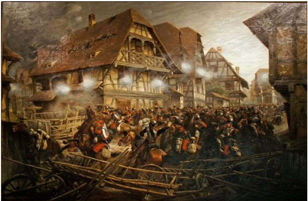
Fremstilling af de blodige kampe i og omkring Sedan 1. september 1870

https://www.youtube.com/watch?v=RgE01ASURF8 ( https://www.youtube.com/watch?v=RgE01ASURF8 )