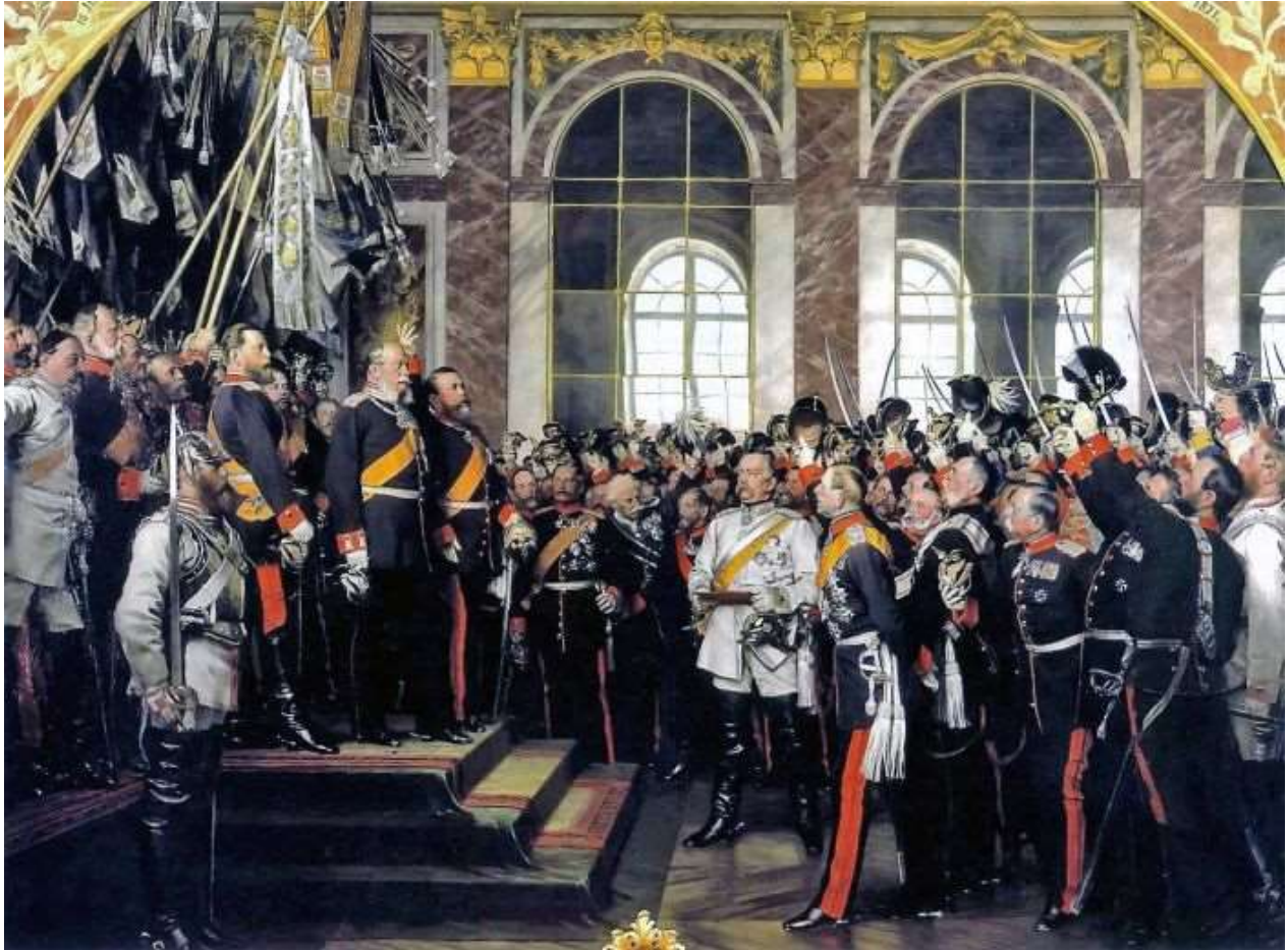
Den 18. januar nåede Bismarck målet. Maleriet af Anton von Werder fra 1885. Det er hans 3. udgave af sceneriet

Kort før krigens egentlige afslutning skete der noget epokegørende: "Den 18. januar 1871 kunne beboerne i den tidligere franske kongeby Versailles iagttage et væld af køretøjer og ryttere på vej mod byens imponerende slot. Det var i sig selv ikke bemærkelsesværdigt at se civile og uniformerede tyskere i livlig færd til og fra solkongens palads, for siden oktober havde slottet og de tilliggende bygninger fungeret som det kongelige preussiske hovedkvarter... Denne dag var det ikke militære kurerer med meddelelser til Moltke og generalstaben, der ankom til slottet, eller ministre og statssekretærer, som skulle mødes med Bismarck for at tale preussiske indenrigsanliggender. I stedet var der tale om et publikum af tyske prinser, adelige, officerer og embedsmænd, som skulle overvære, at Preussens kong Wilhelm samme dag skulle hyldes som tysk kejser..." (S. 267f). I den 700 kvadratmeter store spejlsal.