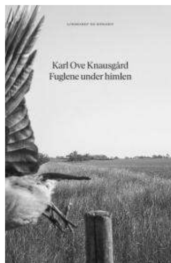
(/index.php/boeger/fuglene-under-himlen) FUGLENE UNDER HIMLEN (/INDEX.PHP/BOEGER/FUGLENE-UNDER-HIMLEN) Af Karl Ove Knausgård