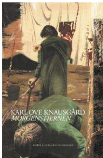
(/index.php/boeger/morgenstjernen) MORGENSTJERNEN (/INDEX.PHP/BOEGER/MORGENSTJERNEN) Af Karl Ove Knausgård