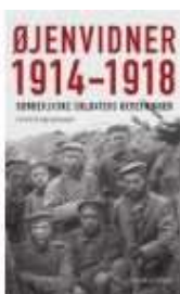
ØJENVINDNER 1914-1918. SØNDERJYSKE SOLDATERS BERETNINGER

( https://www.historie-online.dk/boger/anmeldelser-5-5/1-verdenskrig-53-53-53/ojenvindner-1914-1918-soenderjyske-soldaters-beretninger )