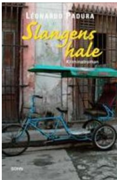
(/boeger/slangens-hale) SLANGENS HALE (/BOEGER/SLANGENS-HALE) Af Leonardo Padura