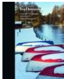
TRAP DANMARK BIND 29

( http://www.historie-online.dk/boger/anmeldelser-5-5/15-1600-arene-renaessancen-33/aalborg-1300-1660-by-slot-og-befaestning )