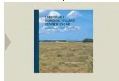
LANDBRUG I NORDVESTJYLLAND

( http://www.historie-online.dk/boger/anmeldelser-5-5/lokal-og-slaegtshistorie/trap-danmark-bind-29 )