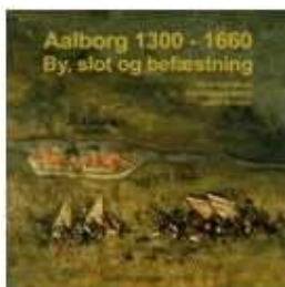
AALBORG 1300-1660. BY, SLOT OG BEFÆSTNING

( http://www.historie-online.dk/boger/anmeldelser-5-5/15-1600-arene-renaessancen-33/aalborg-1300-1660-by-slot-og-befaestning )