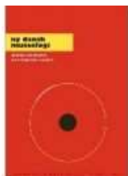
NY DANSK MUSEOLOGI

(/article/items/view/2951/4) ( http://www.historie-online.dk/boger/ny-dansk-museologi ) ( http://www.historie-online.dk/boger/ny-dansk-museologi )