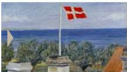
EN VIDUNDERLIG VERDEN