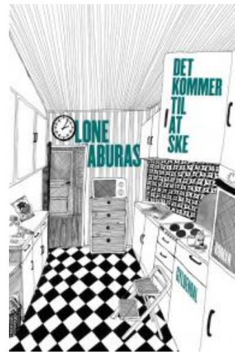
(/boeger/det-kommer-til-ske) DET KOMMER TIL AT SKE (/BOEGER/DET-KOMMER-TIL-SKE) Af Lone Aburas