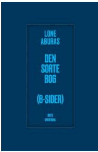
(/boeger/den-sorte-bog-b-sider) DEN SORTE BOG (B-SIDER) (/BOEGER/DEN-SORTE-BOG-B-SIDER) Af Lone Aburas