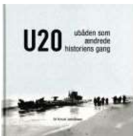
▶ U20. UBÅDEN DER ÆNDREDE HISTORIENS GANG

( https://www.historie-online.dk/boger/anmeldelser-5-5/krig-og-terror-militaerfaesen-vaben-den-kolde-krig/u20-ubaaden-der-aendrede-historiens-gang )