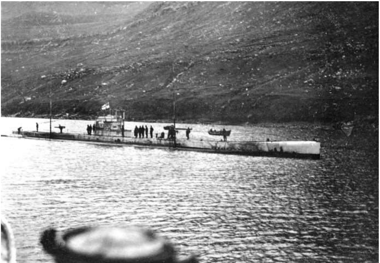
U 55 i Borðoyarvík fjorden. Det korte ophold med reparationer gik ikke upågtet hen. Nysgerrige færinger kikker på både fra bredden og til søs. Bemærk fx den lille båd lige bag u 55's fordæk.