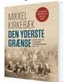
▶ DEN YDERSTE GRÆNSE

( https://www.historie-online.dk/boger/anmeldelser-5-5/1-verdenskrig-53-53-53/genforeningen-1920 )