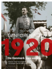
▶ GENFORENINGEN 1920

( https://www.historie-online.dk/boger/anmeldelser-5-5/krig-og-terror-militaerfaesen-vaben-den-kolde-krig/u20-ubaaden-der-aendrede-historiens-gang )