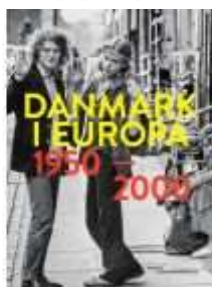
DANMARK I EUROPA, 1950-2000.