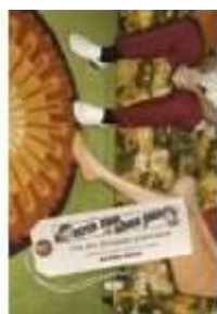
PETER SPAR OG SØREN SOLD - OM DEN FORSIGTIGE GENERATION

( http://www.historie-online.dk/boger/peter-spar-og-soeren-sold-om-den-forsigtige-generation )