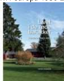
LIVET I DE RØDE BARAKKER

( http://www.historie-online.dk/boger/anmeldelser-5-5/danmark-i-europa-1950-2000 )