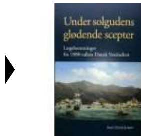
▶ UNDER SOLGUDENS GLØDENDE SCEPTER

( http://www.historie-online.dk/boger/anmeldelser-5-5/sundhed-sygdom/under-solgudens-gloedende-scepter ) ( http://www.historie-online.dk/boger/anmeldelser-5-5/sundhed-sygdom/dansk-medicinhistorisk-aarbog-2019 )