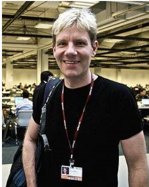
Bjørn Lomborg i en stram t-shirt. En mand, som ikke frygter den globale opvarmning, fordi han personligt har valgt kun at gå i t-shirt.

Afslutningsvis vil jeg gerne stille spørgsmålstejn ved bogens og spilteoriens bagvedliggende ideologi. Er denne stivstikkerteori virkelig demokratiets redning og kritiske stemme? Nej, det er en moralsk anløben og farlig ensidighed, som har bragt demokratiet og samfundet i krise. Lad mig illustrere det med en anekdote: Lomborg er i dag landets mest indflydelsesrige spilteoretiker. En mand, som ikke frygter den globale opvarmning, fordi han personligt har valgt kun at gå i stramt siddende t-shirts. Magen til egocentrisk snæversyn og personlig nyttemaksimering skal man lede længe efter, men det er helt fornuftigt, hvis man spørger spilteorien.