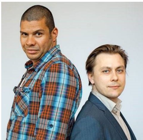
Pelle og Professorens