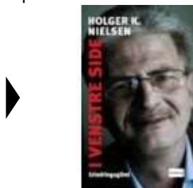
I VENSTRE SIDE

( http://www.historie-online.dk/boger/danmark-i-krig )