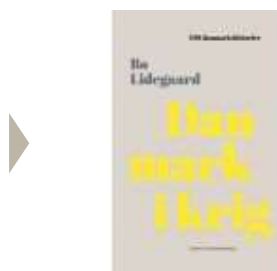
DANMARK I KRIG

( http://www.historie-online.dk/boger/danmark-i-krig )