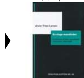
EN SLAGS MANDINDER

( http://www.historie-online.dk/boger/anmeldelser-5-5/danmark-og-europa-efter-1945/i-venstre-side )