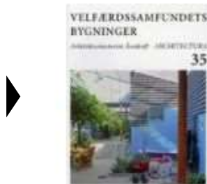
▶ VELFÆRDSSAMFUNDETS BYGNINGER. ARCHITECTURA 35

( http://www.historie-online.dk/boger/anmeldelser-5-5/kunst-arkitektur-haver-design-mode/velfaerdssamfundets-bygninger-architectura-35 )