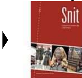
▶ SNIT - INDUSTRIALISMENS TØJ I DANMARK

( http://www.historie-online.dk/boger/anmeldelser-5-5/kunst-arkitektur-haver-design-mode/velfaerdssamfundets-bygninger-architectura-35 )