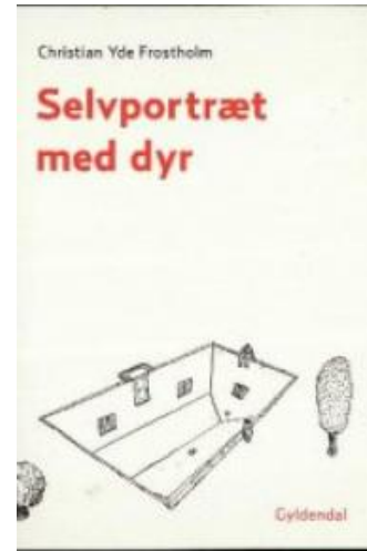
(/boeger/selvportraet-med-dyr) SELVPORTRÆT MED DYR (/BOEGER/SELVPORTRAET-MED-DYR) Af Christian Yde Frostholm