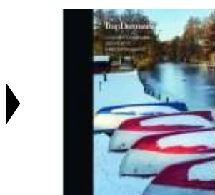
TRAP DANMARK BIND 29

( http://www.historie-online.dk/boger/anmeldelser-5-5/lokal-og-slaegtshistorie/trap-danmark-bind-29 )