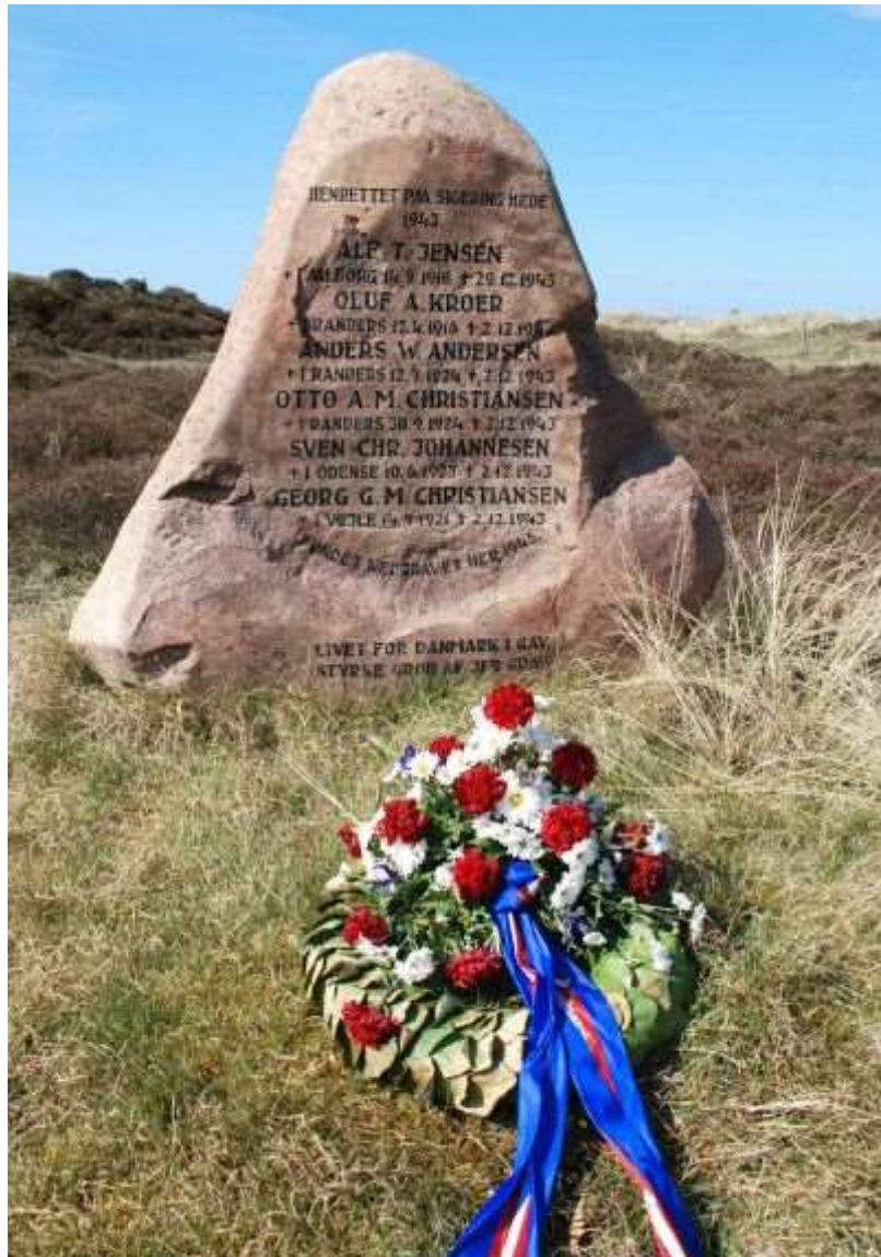
Mindesten i Husby Klit for de henrettede modstandsfolk.

Den 2. december omkring klokken fem fik 5 modstandsfolk, der sad i Aarhus Arrest ved Vester Allé, at vide, at de skulle henrettes inden for de næste to timer. En delegation havde været i Silkeborg bad for at søge om benådning hos von Hanneken, hvilket han blankt afviste.