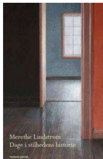
(/boeger/dage-i-stilhedens-historie) DAGE I STILHEDENS HISTORIE (/BOEGER/DAGE-I-STILHEDENS-HISTORIE) Af Merethe Lindstrøm