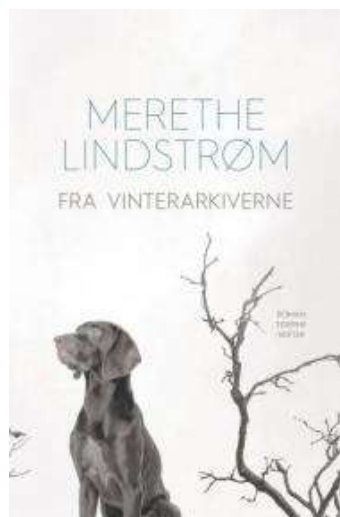
(/boeger/fra-vinterarkiverne) FRA VINTERARKIVERNE (/BOEGER/FRA-VINTERARKIVERNE) Af Merethe Lindstrøm