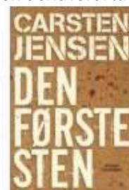
▶ CARSTEN JENSEN: DEN FØRSTE STEN

( http://www.historie-online.dk/boger/anmeldelser-5-5/romaner/carsten-jensen-den-foerste-sten )