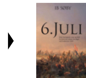
▶ 6. JULI

( http://www.historie-online.dk/boger/anmeldelser-5-5/romaner/6-juli ) ( http://www.historie-online.dk/boger/anmeldelser-5-5/romaner/oehavsfortaelling )