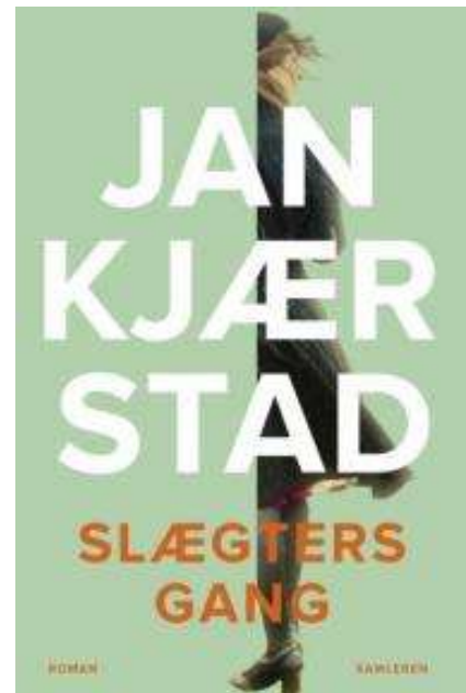
(/boeger/slaegters-gang) SLÆGTERS GANG (/BOEGER/SLAEGTERS-GANG) Af Jan Kjærstad