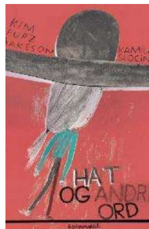
(/boeger/hat-og-andre-ord) HAT OG ANDRE ORD (/BOEGER/HAT-OG-ANDRE-ORD) Af Kim Fupz Aakeson og Kamila Slocinska (Ill.)