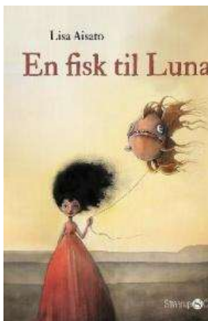
(/boeger/en-fisk-til-luna) EN FISK TIL LUNA (/BOEGER/EN-FISK-TIL-LUNA) Af Lisa Aisato